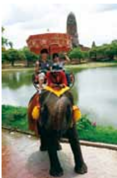
奥様とタイ旅行にて

私は今年、大学入学早々山岳部に入り、頻りに山に登る生活を送っています。わが一橋山岳部は九十年以上の歴史を持ちながら、数年前までは部員がいらないという危機的状況だったらしいです。それをOBと先輩方が地道に復活させ、そこに私が一年生として入部したということです。なので部はいきいきとした雰囲気でも楽しいのです。三田高とは今でも少しだけ関わっています。私はワングルの部長だったのですが今では山行のたびにOBとして参加しています。もちろん登山だけではなく大学ではサークルにも入り社会問題について東大生と一緒に勉強しています。それらを両立することに苦心しているのですが文武両道でとても充実した日々を送っています。