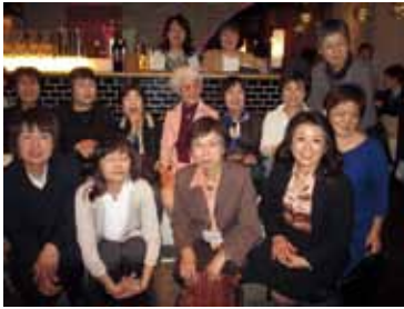
元3年2組(女子組)の皆様

まず3年女子組の方たちに連絡し、「女子であれば何組でも」と口コミで広げたところ、参加者は50名超に。女性が出にくい夜を避け、昼下りのレストランで挨拶も式次第もなしの3時間。久々の級友と会い、代わる代わる先生の席に行き、会話と席移動で店内にエネルギーが溢れます。女子組が好きだった人、嫌だった人、女子組になつたことがない人、皆、表情はほとんどん当時に戻り、あちこちで「女だけって、いいな」という声か。三田の女子力は、年月をを経て、澁刺、高品質、ハイパワーです。