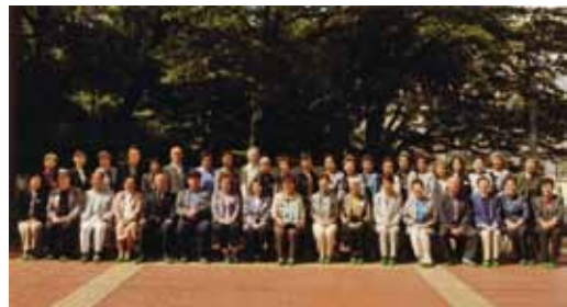
ホームカミングご出席の6回生の皆様

去る五月十八日、ワカバ会から、われら三田六回生が総会・懇親会にご招待いただいた。卒業生男百名、女二百五十名、計約三百五十名のうち一割を超す四十名が参加した。来年傘寿(八十歳)を迎えるわれわれにしては、望外の好成績と言わべきだろう。ちょうど十年前に卒業五十周年の集りをしていたので新校舎も二回目、もちろんこの齢でも相手を見誤ることもなく、今回も和気あいあいと校庭で過ごしたことであった。この催しは十年ごとに順番が回ってくるので、次回のわれわれは八十八歳。何人が参加できるかひとしきり話に花が咲いた。毎年こうして準備してくださつて私どもを呼んでくださるワカバ会や先生方のご好意に深く感謝申し上げます。