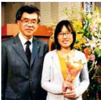
お嬢様のお祝いの時に

三田高・大学卒業後、電機メーカー に就職し、結婚後4人の子どもが与え られました。5年前に妻は天国に行き、 昨年会社を早期退職。現在別の会社に 勤めています。妻から託された子ども の巣立ちの準備や、親の介護をしつつ、 私の人生の残りの楽章を、私なりに奏 でていきたいと思えます。大丈夫！共 に素敵な想い出を共有し、現在それぞ れの所ががんばっている友がいますか ら。