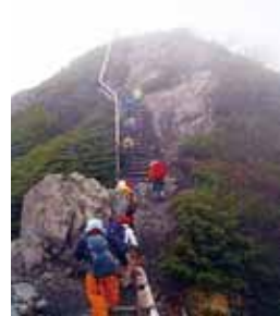
北岳登山の時 一番手前で頭を タオルで巻いているのが筆者