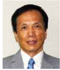
猛暑や 自然災害 の続いた