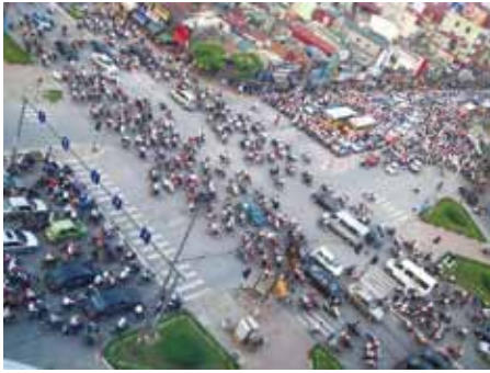
“バイクの洪水” ～ハノイオフィスからの日常風景～

昨年ベトナムから日本に帰国致しました。ベトナムは、米国・タイに次ぐ3ヶ国目の駐在でしたが、とても魅力的な国でした。住めば都とはよく言ったものです。すさまじい数のバイク、その「バイクの洪水」の中を申し訳なさそうに走行する車の景色は圧巻です。そんなベトナムですが、住んでいる人々って何か「三田高生臭」がすると思います。真面目で非常に勤勉、なのに社会主義国家体制の中、あれだけ個性豊かで自由闊達な人々には三田高生の校風と何か重なるものがあり、非常に親近感を覚えます。日本の生活にもやっと慣れてきた今日この頃ですが、忙殺の日々が続き、日本の常識、世界の非常識と日々奮闘しています。自分の中の奥底にいる忘れかけていたベトナム人魂、いや三田高生魂を懐かしくも思い、襟を正す思いでもありません。