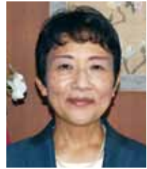
平成26 年4月1 日に、三